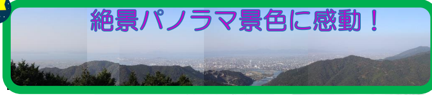
絶景パノラマ景色に感動！

ハ竜天文台の職員の方のご厚意に感謝、感激！建物横まで車両の乗り入れやトイレの解放など、気持ちよく見学できました。また、行くことと思います。